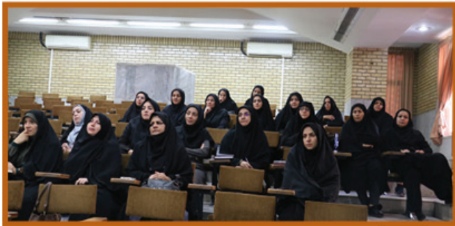
۱۲- برگزاری کلاس های آموزشی ویژه کارکنان با موضوع فرزندآوری و سلامت