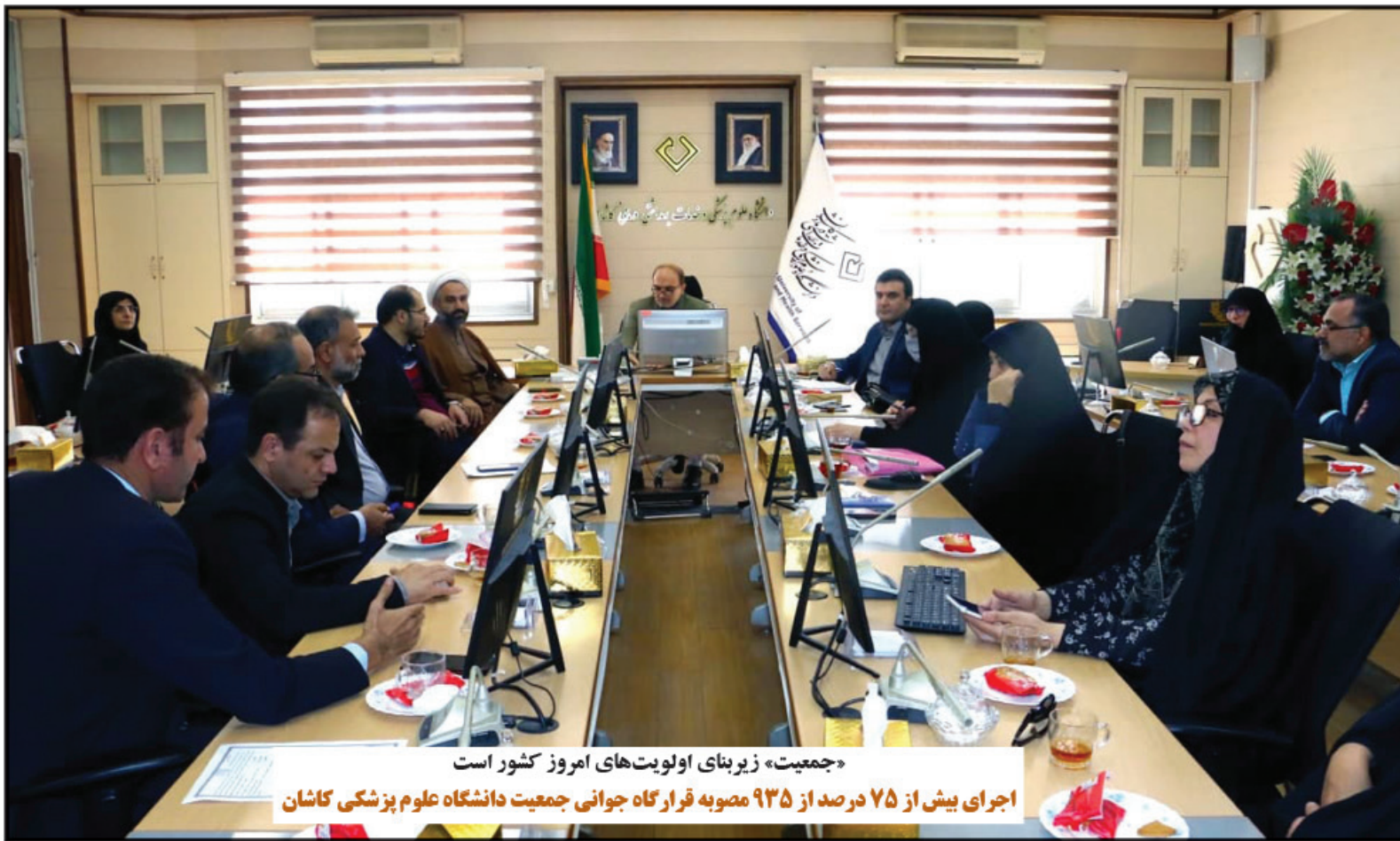
«جمعیت» زیربنای اولویت‌های امروز کشور است

اجرای بیش از ۷۵ درصد از ۹۳۵ مصوبه قرارگاه جوانی جمعیت دانشگاه علوم پزشکی کاشان